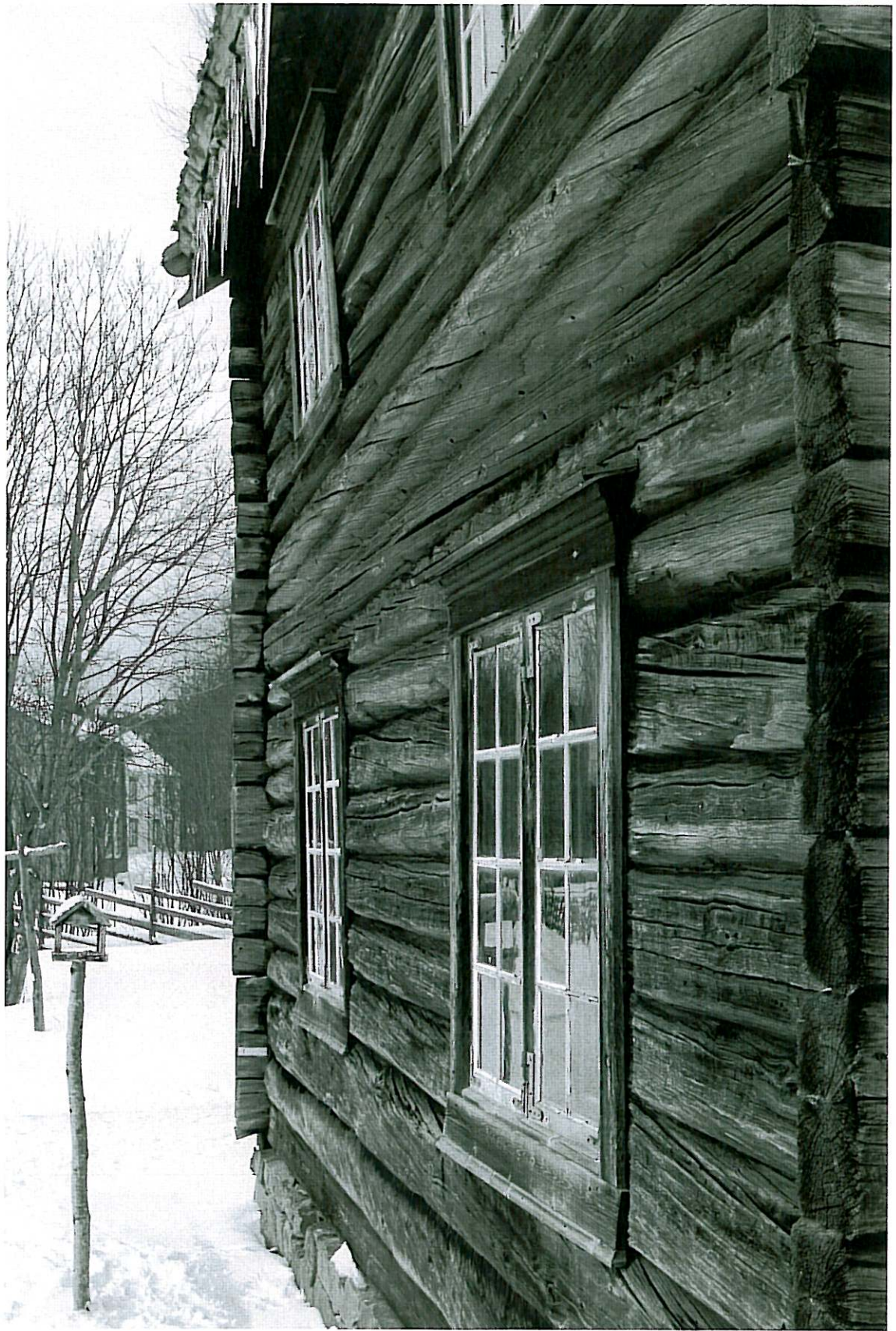
ÅPEN BARNEHAGE PÅ SVERRESBORG TRONDELÅG FOLKEMUSEUM